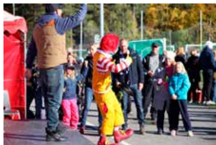
Dogge Doggelito och Ronald McDonal