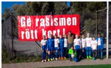
Dogge Doggelito med glada fotbollsspelare.