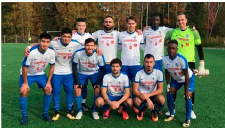
A-laget säsongen 2018.

Efter pausen fortsätter vi vårt fina spel, och innan matchen blåstes av hade både Fabrice och Pancho gjort var sitt mål genom fin teknik och fina skarvar. IK Viljan gör däremellan ett mål och