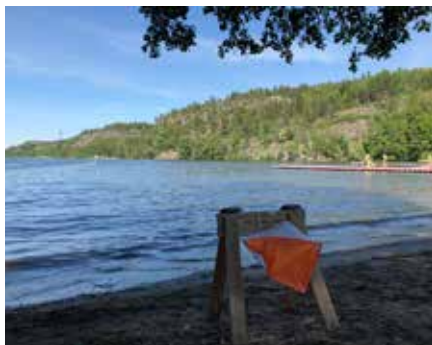
Kontroll vid sjö.