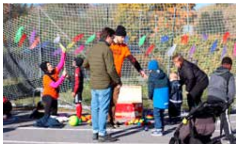
Cirkus Cirkör Dogge Doggelito och Ronald McDonal