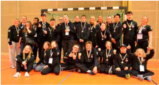
Vinnarna av Special Olympics i Göteborg.