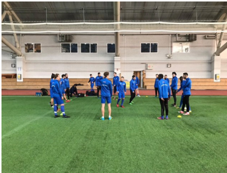
A-laget på träningsläger i Kristinehamn.