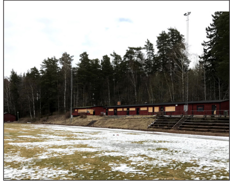
Sista bilden på gamla Rödstu Hage innan renoveringen.

De kan vara glada, ledsna, trygga, självsäkra, osäkra, envisa, finurliga, lata, ambitiösa, noggranna, slarviga, charmiga, egoistiska, pratiga, tillbakadragna och så vidare... Som ledare är det en utmaning att möta alla dessa barn och egenskaper. Med utgångspunkt i din kunskap, ditt engagemang och ditt tålamod tar du hand om deras friidrottsträning och skänker dem mycket glädje, gemenskap, spänning och utveckling