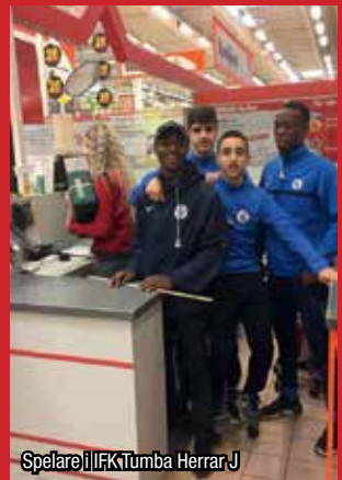
Spelare i IFK Tumba HerrarJ

I år har dessa tillfällen varit långfredagen, första maj och Kristi himmelfärdsdag. Då har representanter från HerrarJ, lag P03 och P01 förutom att de bistått kunder varit fina ambassadörer för Tumba Fotboll genom att t.ex. marknadsföra klubbens motto "Ge rasismen rött kort", berättat om Prova-på-fotbollen i maj och juni för flickor och pojkar födda 2011 och delat ut bl.a. Teskedsordens bok "Vem är Du" - en bok om tolerans.