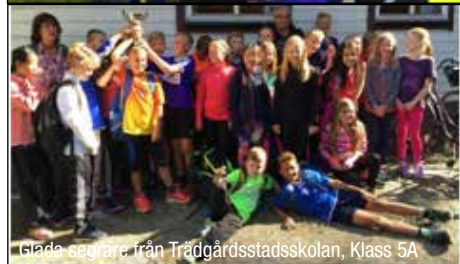
Glada segrare från Trädgårdsstadsskolan, Klass 5A