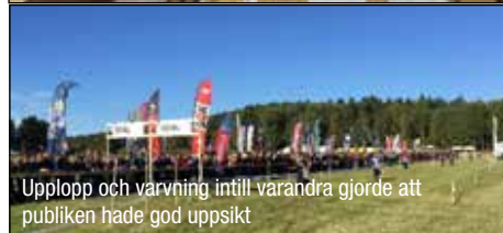
Upplopp och varvning intill varandra gjorde att publiken hade god uppsikt