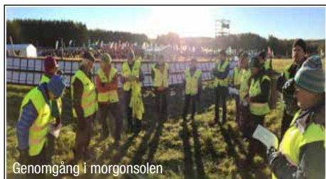
Genomgång i morgonsolen

vid målet och 25 vid kartplanket. Vid kartplanket gäller det att se till att löparna lätt får tag i sina kartor för växling till nästa löpare. Det innebär att 9 000 kartor ska vikas fram så fort en löpare passerat. Kan emellanåt bli lite halvstressigt när världseliten och motionärer uttröttade efter ett tufft lopp stormar fram! Eftersom många av funktionärerna ville jobba halvdag och flera själva sprang stafetten så hade vi 50 personer, som var i farten under tävlingen. I år gick 25männa vid Lövsättra i södra Vallentuna med Täby, Järfälla, Väsby och Vallentuna-Össeby som arrangörer. Totalt jobbar nästan 500 funktionärer på tävlingsdagen!