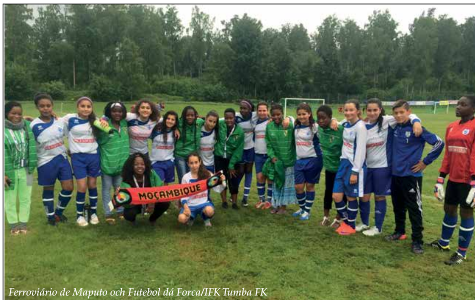
Ferrováriario de Maputo och Futebol dá Força/IFK Tumba FK