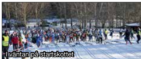
I väntan på startskottet

skiddag med blå himmel och strålande sol. Ett par grader varmt och lite för mycket blåst, men annars perfekt!