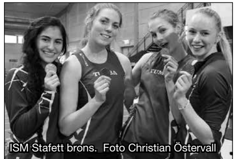
ISM Stafett brons.