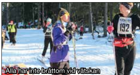
Alla har inte bråttom vid vätskan

Starten gick utmärkt och det tog bara 4 minuter innan siste åkare lämnade startgården. Allt flöt väldigt bra och åkarna var nästan lyriska när dom kom i mål. Man var överraskad av de fina spåren och man uppskattade verkligen den positiva servicen från alla våra funktionärer!