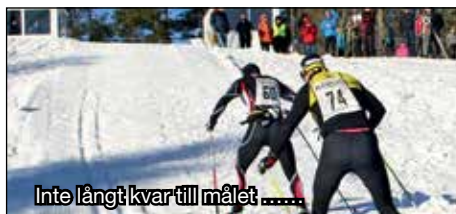
Inte långt kvar till målet.....

Vätskekontrollerna fanns vid Brantbrink och vid varvningen på Lida. Målservingen hade i år förbättrats med ett tält och menyen förstärks med bananer, bullar och nypon-soppa!