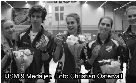
IJSM 9 Medaljer.