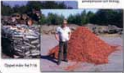
Öppet måndag till 16

Skiva och och skivkraft, för haverering och skivmaterial, till Ristning (Skivkraft) är spåntskivmaterial och under- lag, vi producerar skivkraft och skivkraft och till skiva skivkraft och skivkraft